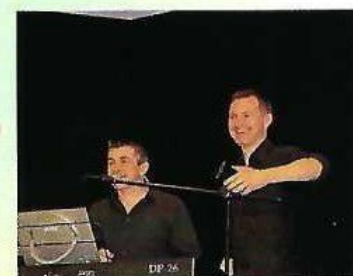
LA BOITE À DANSER