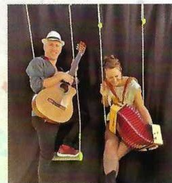
UN AIR DE 2 AIRS